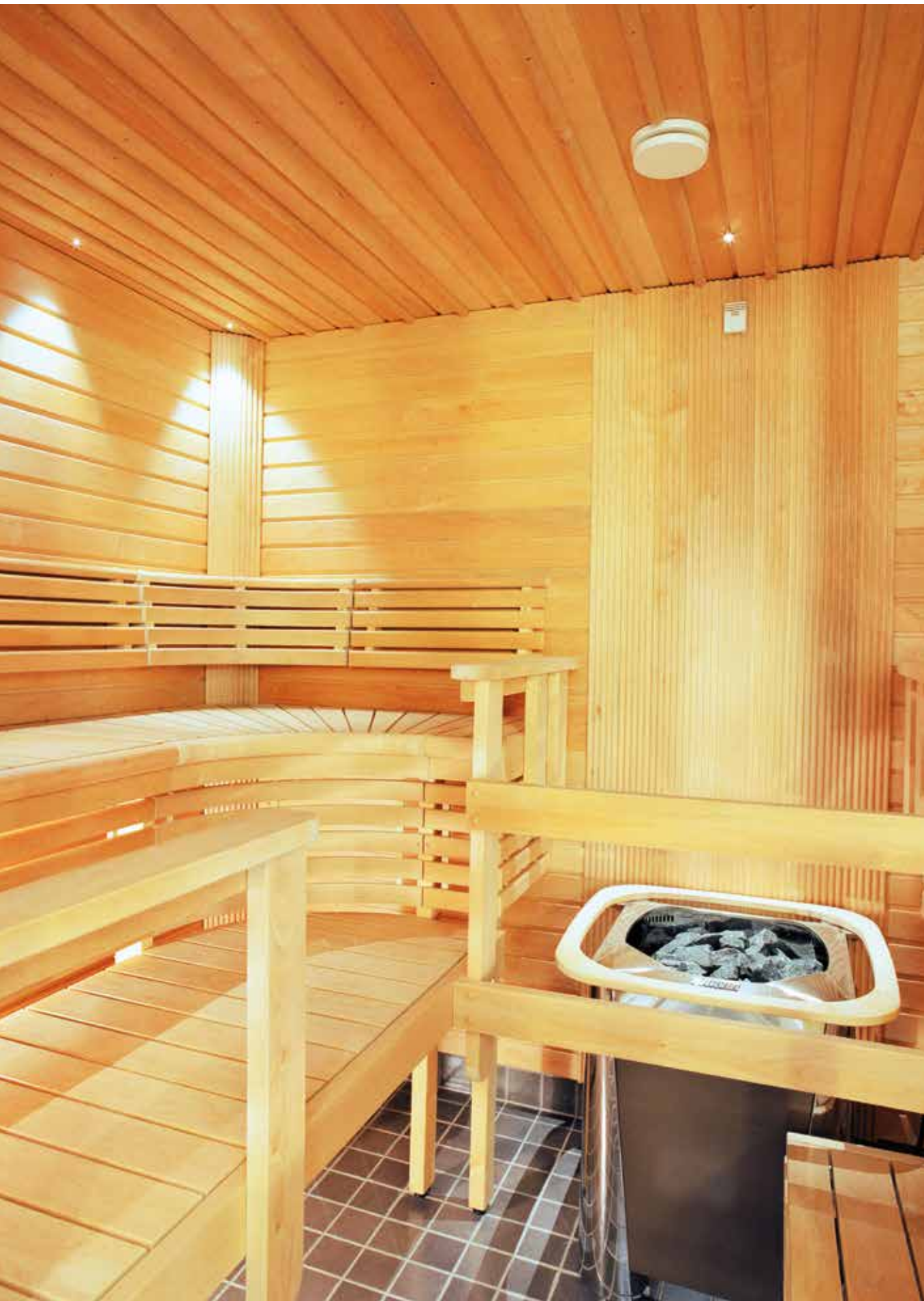
Mestan tuotantoa, rakentaja Mesta Kodit Oy