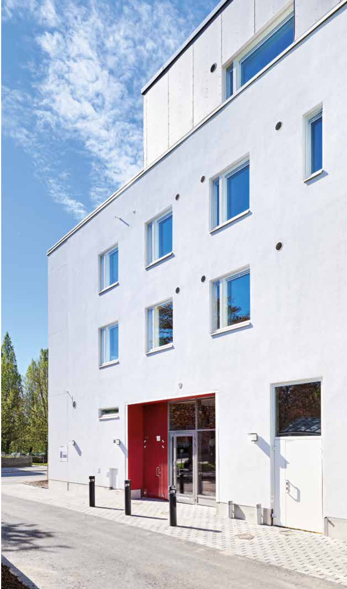
Kuva: Tius Verhe (As Oy Mäkitorpanie 30, Lapti Oy)